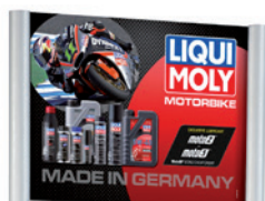
オートバイ用トップボード Motorbike topper for Futura shop, part no. 50160

プラスチックラック(トップボードは付属されてません) Futura shop empty, part no. 9989