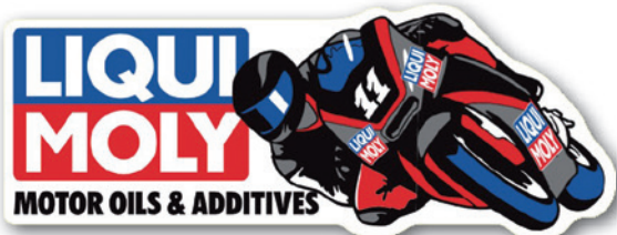
ステッカー Motorbike Sticker, part no. 8543

カウンターディスプレイ Counter display, part no. 9965