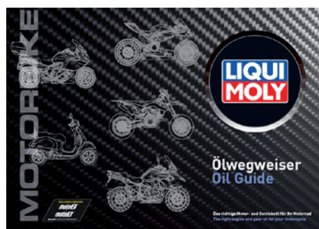
オートバイ用オイルガイドブック Oil guide Motorbike, part no. 8769

「20ℓ容器と1ℓボトルの収納が可能です」 Individual filling with 20 liter and 1 liter containers.