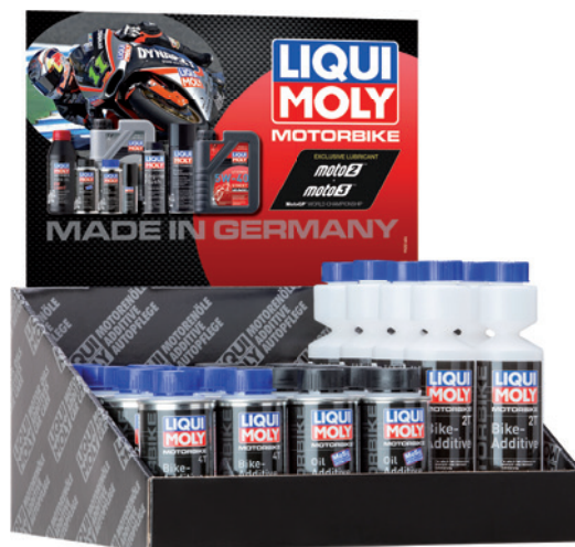
カウンターディスプレイ用トップボード (Moto GP) Topper counter display MotoGP, part no. 9925

カウンターディスプレイ Counter display, part no. 9965