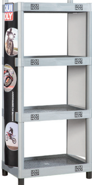
オートバイ用サイドパネル(2枚セット) Side sections for Futurashop Motorbike (2 pieces), part no. 5247

プラスチックラック(トップボードは付属されてません) Futura shop empty, part no. 9989