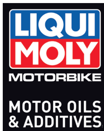
オートバイ用プラスチックロゴボード Motorbike advertising board, 594 x 745 mm, part no. 9911

「バイクオイルキャビネット プロのオートバイの整備工場のために」 Motorbike oil cabinet for the professional motorcycle workshop, part no. 7990