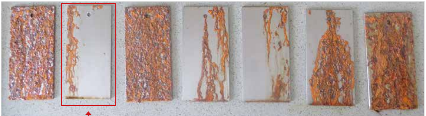
LIQUI MOLY Pflege- und Korrosionsschutzöl

Es wurden definierte Testbleche mit unterschiedlichen Korrosionsschutzölen behandelt und in der Salzsprühkammer bei 35 °C mit einer 5% Natriumchlorid-Lösung über 120 Stunden besprüht. Die Bleche wurden alle 20 Stunden bewertet und dokumentiert. Das Ergebnis sehen Sie hier: